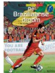
De Braziliaanse droom; 1 De weddenschap