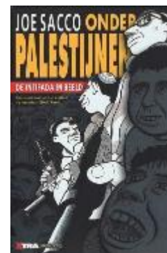
Onder Palestijnen : de intifada in beeld