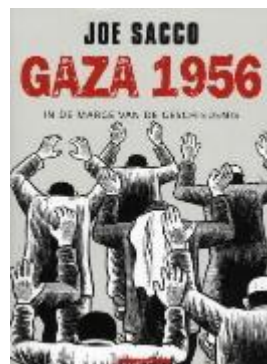
Gaza 1956 : in de marge van de geschiedenis