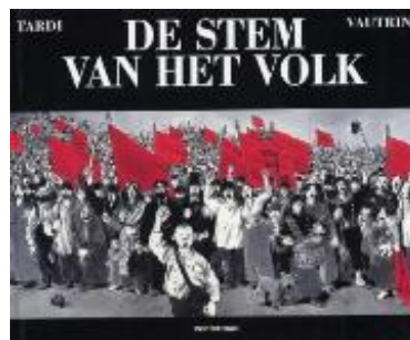
De stem van het volk : integraal