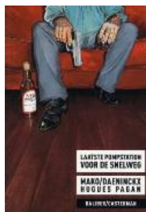
Laatste pompstation voor de snelweg