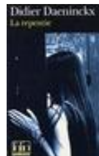
La repentie (Franse roman)