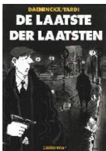
De laatste der laatsten