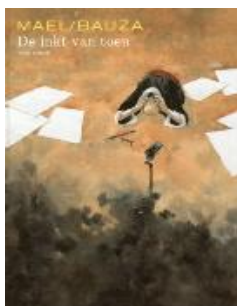
De inkt van toen