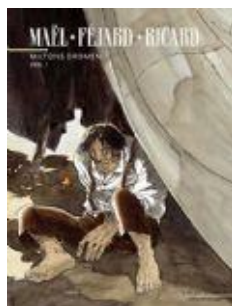
Miltons dromen (2 delen) Collectie Vrije vlucht