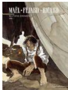
Miltons dromen (2 delen) Collectie Vrije vlucht