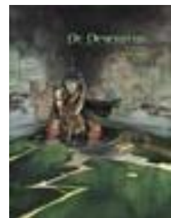
Onheilsnacht De deserteur ; 1