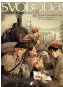
Van Praag naar Tcheliabinsk Svoboda! : Rusland, 1914 - 1920 ; 1