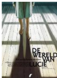
En waarom niet de hel... De wereld van Lucie; 1