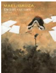
De inkt van toen Collectie Vrije vlucht