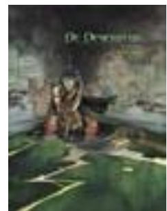
Onheilsnacht De deserteur ; 1