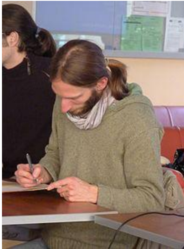
Tekeningen: Martin Leclerc Pseudoniem: Maël