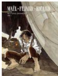
Miltons dromen (2 delen) Collectie Vrije vlucht