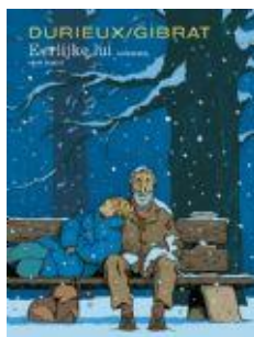
Eerlijke lui (3 dl.)