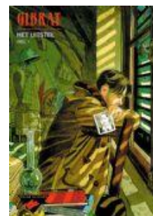
Het uitstel (2 dl.)