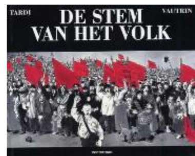
De stem van het volk : integraal