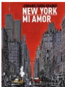
New York mi amor