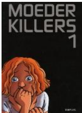
Moederkillers (deel 1) Castigo