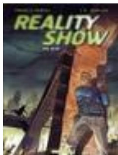
Reality show (deel 1) On air