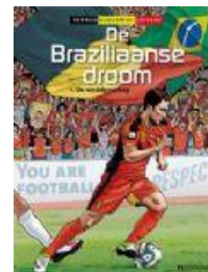
De Braziliaanse droom; 1 De weddenschap