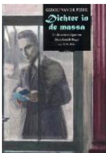
Dichter in de massa