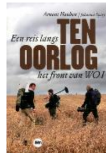
Ten oorlog : een reis langs het front van WO I