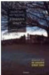
Dood van een soldaat