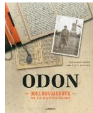
Odon : oorlogsdagboek van een IJzerfrontsoldaat (non-fictie 927.5)