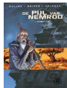
Patiënt 1167 De pijl van Nemrod; 1