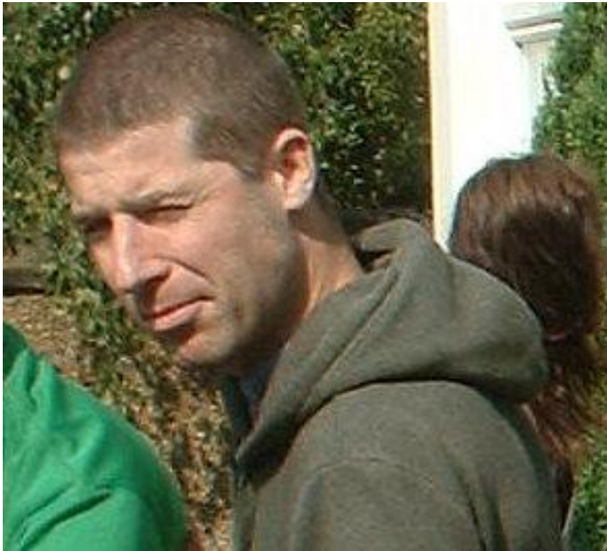
Tekenaar: Bedouel, Fabien