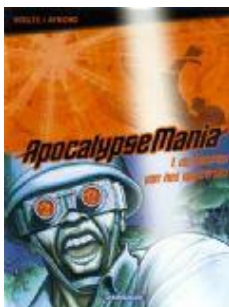
De kleuren van het spectrum ApocalypseMania; 1