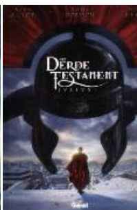
Het derde testament (reeks) deel 1-4