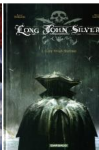
Long John Silver (reeks) deel 1-4