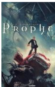
Prophet (reeks) deel 1-2