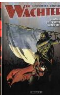
De wachters (reeks) deel 1-3