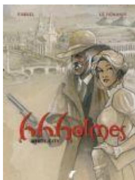
H.H. Holmes (deel 2) White city