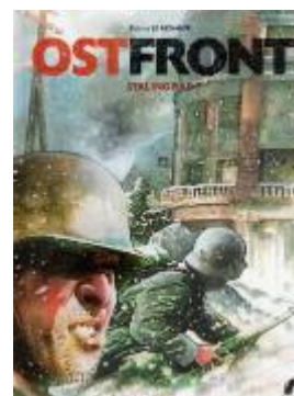
Ostfront (deel 1) Stalingrad