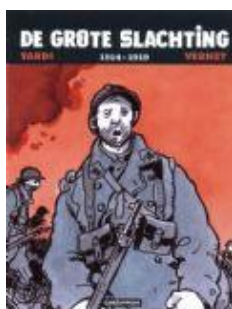
De grote slachting 1914-1919