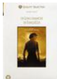
Un long dimanche de fiançailles (DVD)