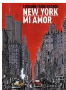
New York mi amor