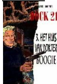
Dock 21 (reeks) deel 1-3