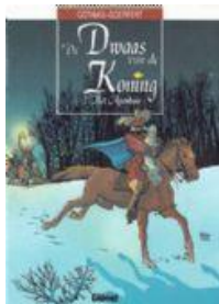
Dwaas van de koning (reeks) deel 1-9