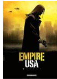
Empire USA (reeks) bestaande uit 2 seizoenen van 6 delen