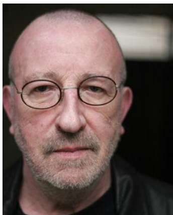
Patrick Cothias Pseudoniem: Bogue