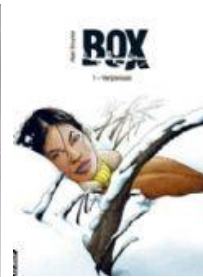
Box (reeks) deel 1-3