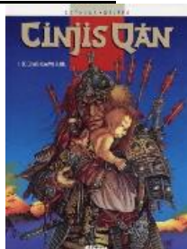
Cinjis Qan (reeks) deel 1-3