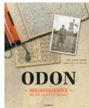
Odon : oorlogsdagboek van een IJzerfrontsoldaat (non-fictie 927.5)